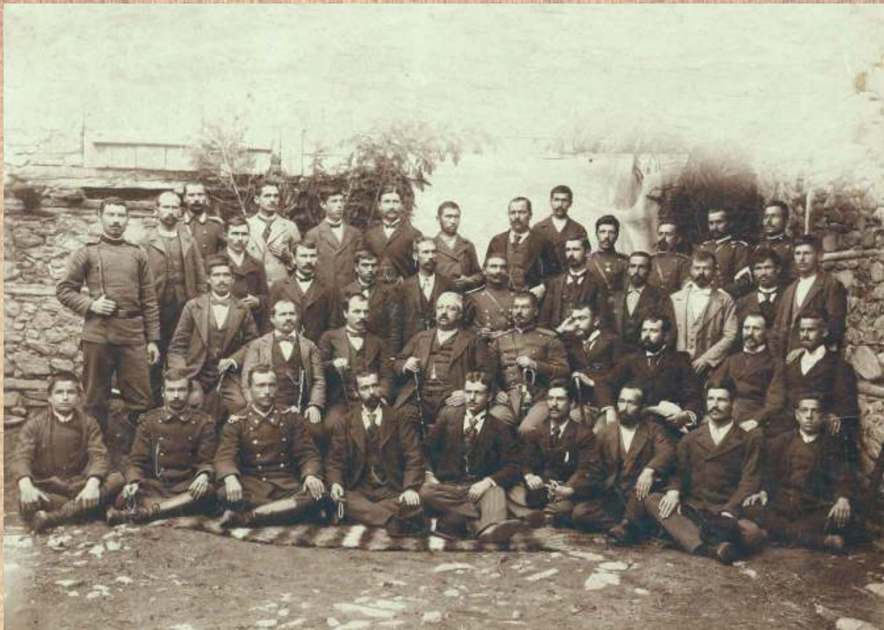
Чиновници от Чепеларе, 1897 г.