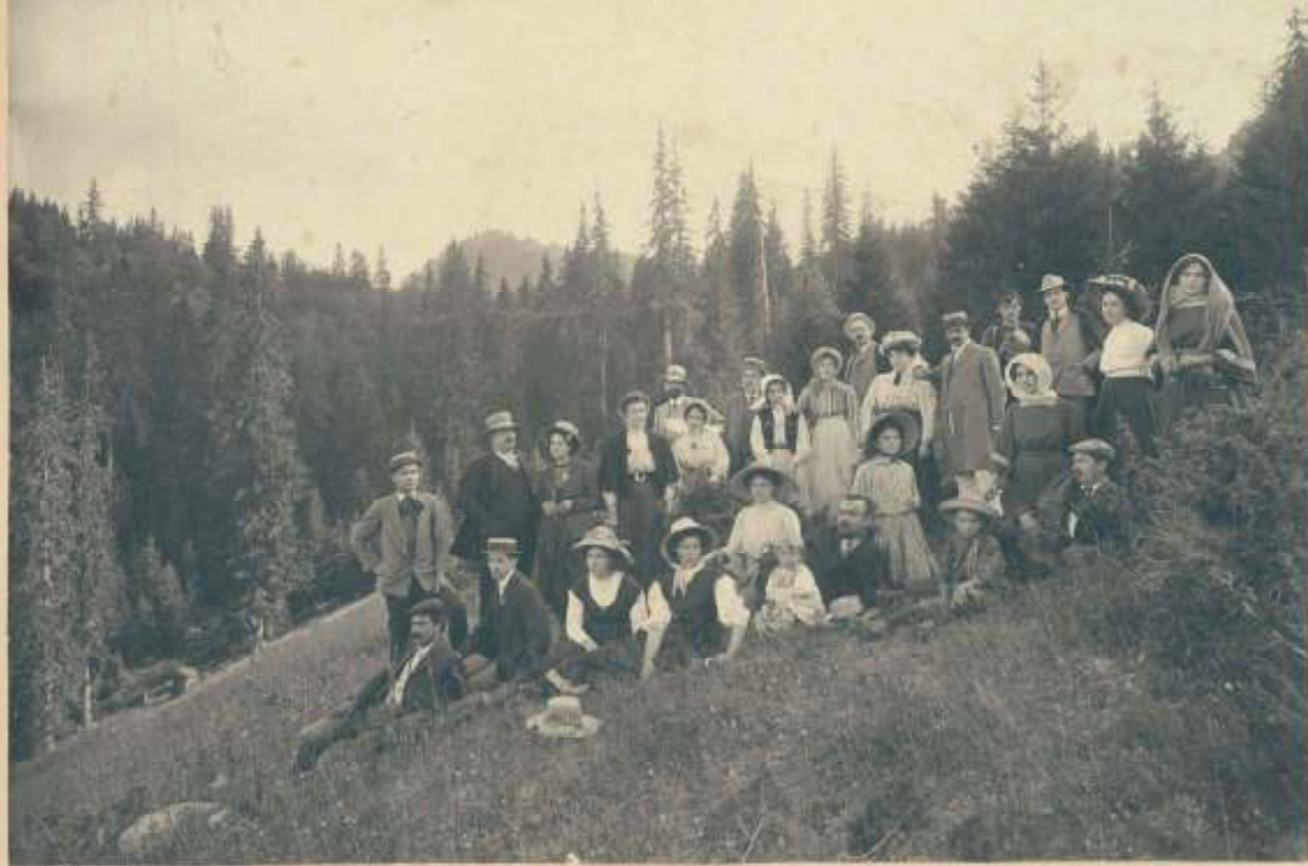
Семейства от Чепеларе на излет в Имаретдере, 29 юли 1910 г.