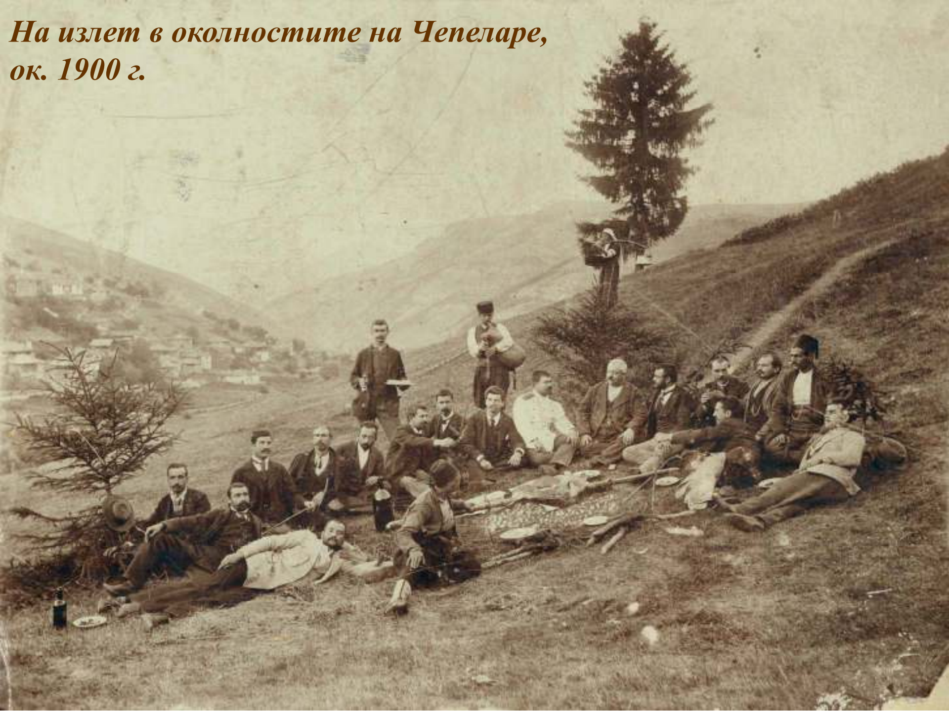
На излет в околностите на Чепеларе, ок. 1900 г.