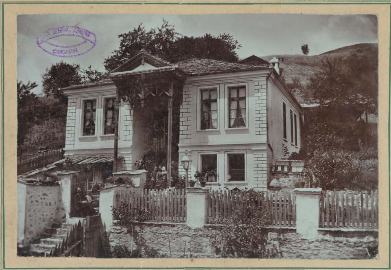
Къщата на Стою Шишков в Чепеларе, 1908 г.