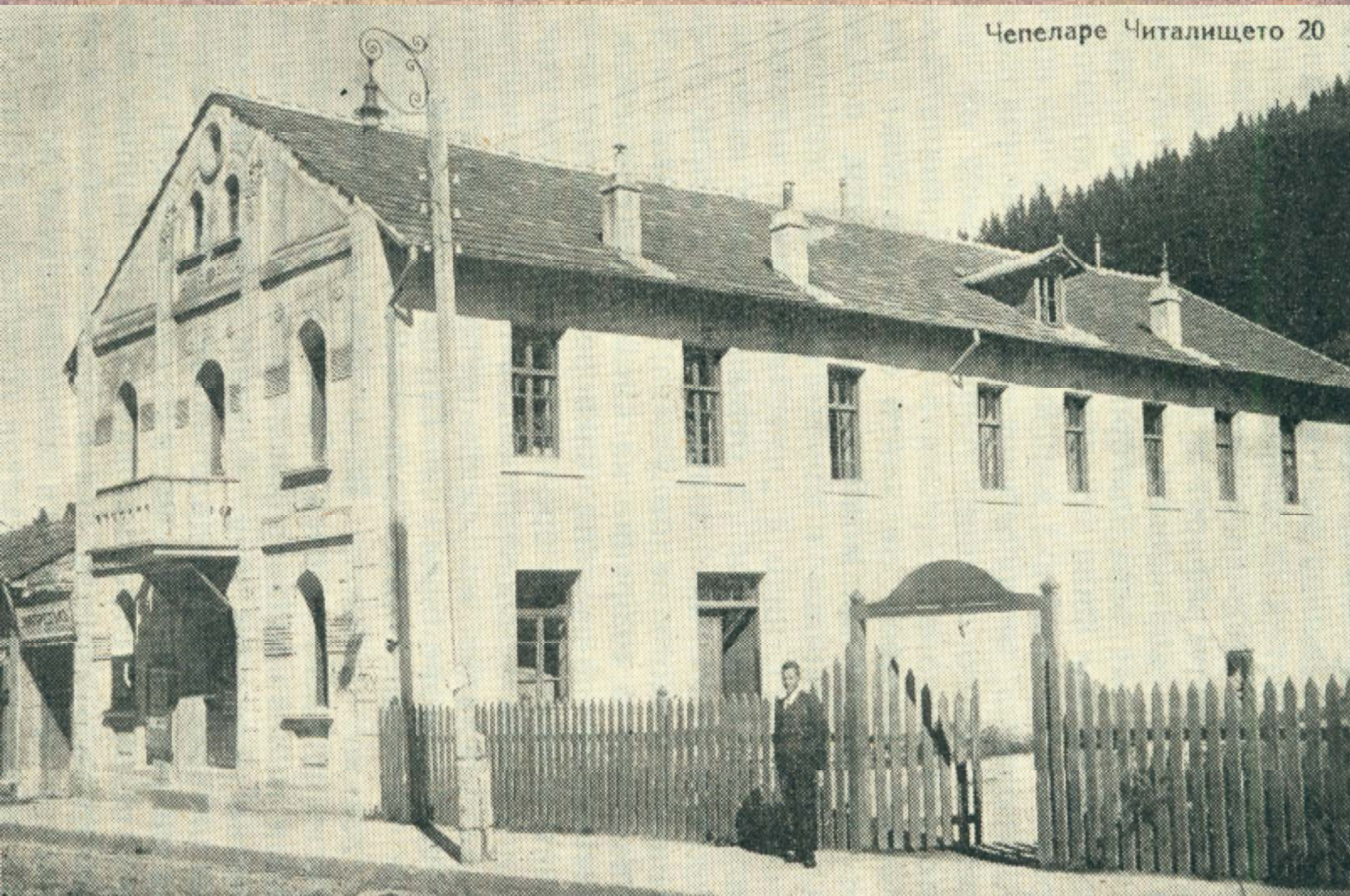
Сградата на читалището в Чепеларе, 1903 г.