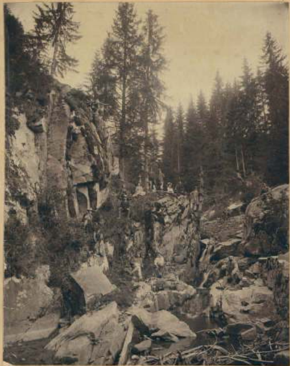
Семейства от Чепеларе на излет в Имаретдере, 29 юли 1910 г.