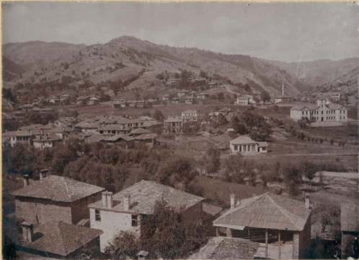
Изглед от Чепеларе през 1910 г.