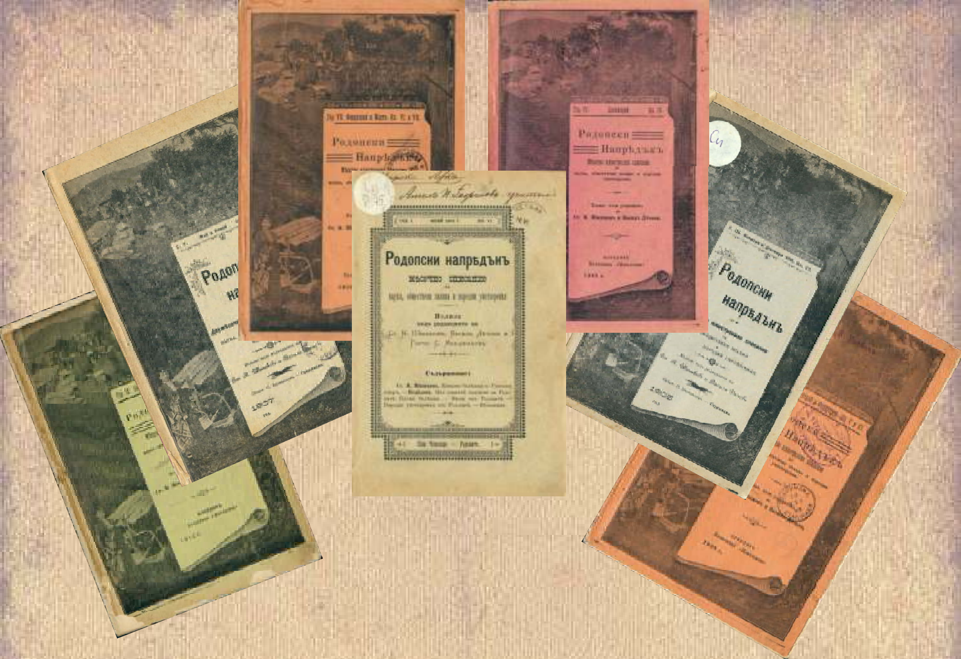
Броеве на списание "Родопски напредък" през годините