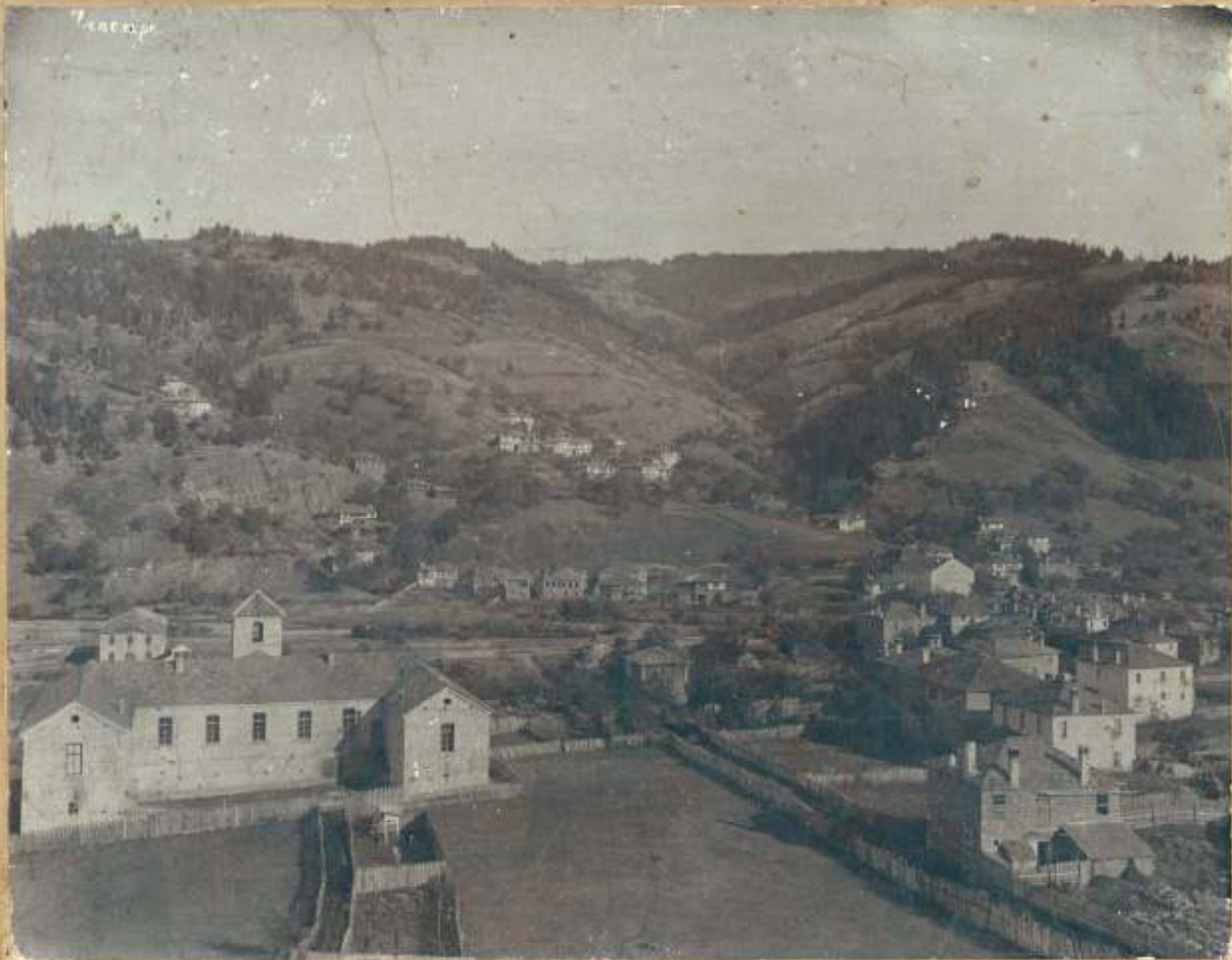
Изглед на Чепеларе с училището, 1903 г.