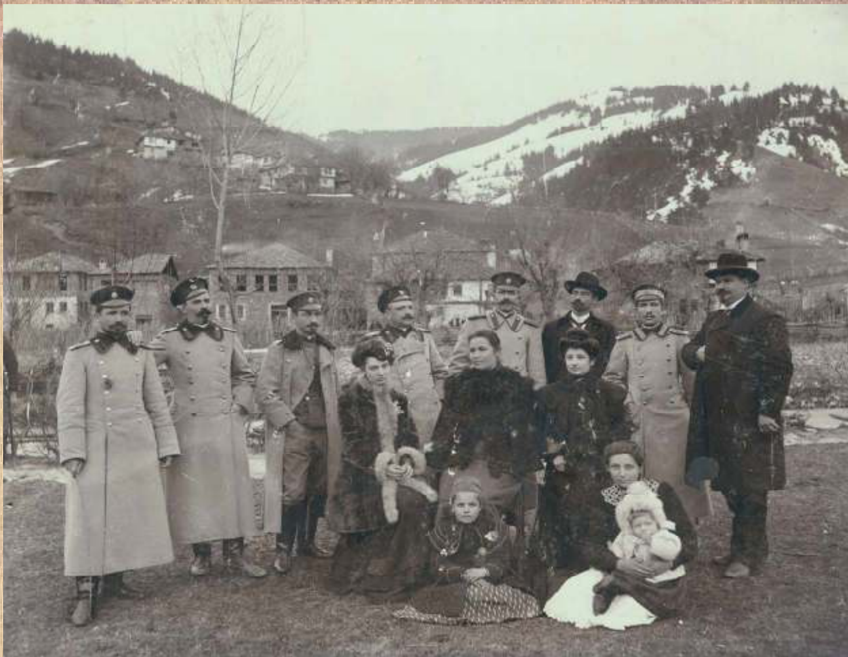
Наборна комисия в Чепеларе, 1906 г.