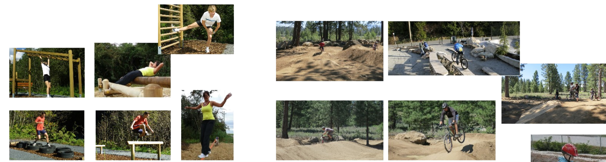
СТАРТ ЗОНА РАЗГРЯВАНЕ