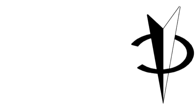
ГОРНА ЛИФТ СТАНЦИЯ